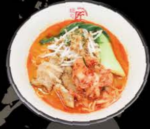
豚キムチ味噌ラーメン Butakimchi Miso Ramen Ramen mit Kimchi und mariniertem Schweinefleisch (Misogeschmack)