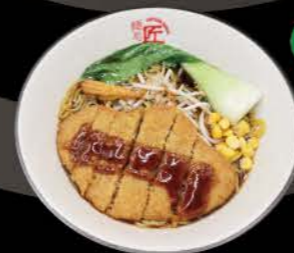
かき揚げベジ醤油ラーメン Gemüse - Tempura Shoyu Ramen Veggie Shoyu Ramen mit Gemüse Tempura