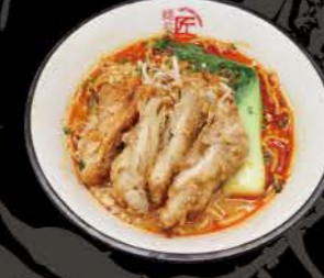
鶏南蛮のせ担々麺 Namban Tan Tan Tan Tan Men mit frittiertem Hähnchenfleisch