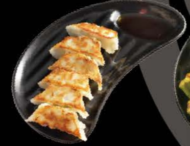
焼き餃子 Gyoza Gebratene Teigtaschen gefüllt mit Hähnchenhackfleisch