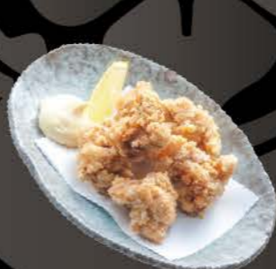
鶏の唐揚げ Karaage Frittiertes Hähnchenfleisch