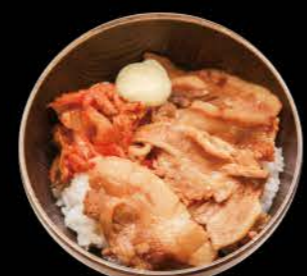
豚キムチ飯 Buta Kimuchi Meshi Kimuchi und Marinierem Schweinefleisch auf Reis