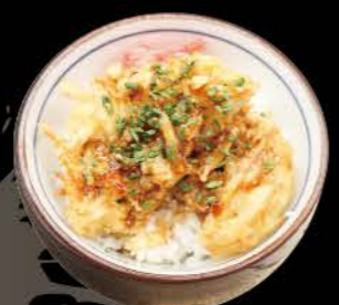
かき揚げ飯 Kakiage Meshi Gemüse Tempura auf Reis