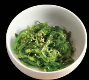
茎わかめ Kuki Wakame Algensalat