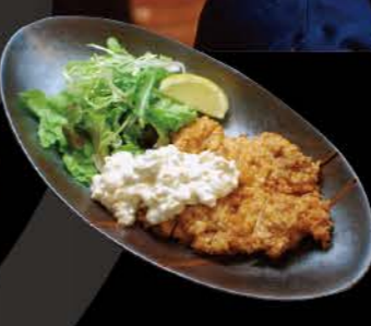
鶏南蛮 Nanban Frittiertes Hähnchenfleisch nach Nanban Art