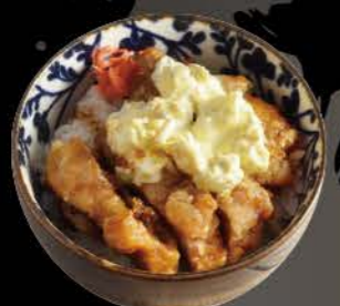
鶏南蛮飯 Nanban Meshi frittiertes Hähnchenfleisch auf Reis