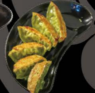
野菜餃子 Yasai Gyoza Gebratene Spinatteigtaschen mit Gemüsefüllung