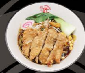
南蛮醤油ラーメン Namban Shoyu Ramen Shoyu Ramen mit frittiertem Hähnchenfleisch