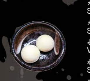
バニラ餅アイス Mochi vanilla ice Vanilleeis gehüllt in japanischen Reiskuchen