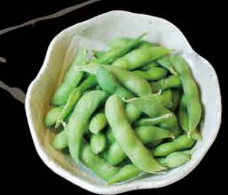
枝豆 Edamame Gekochte Sojabohnen