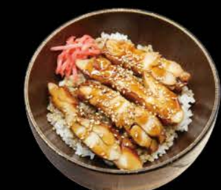
照り焼き飯 Teriyaki Meshi Teriyaki Chicken auf Reis