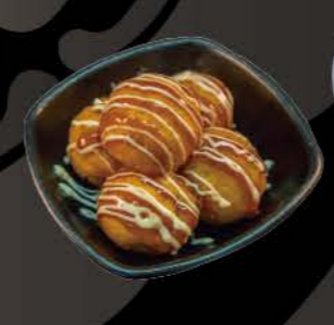
たこ焼き Takoyaki Teigkugeln gefüllt mit Oktopusstückchen