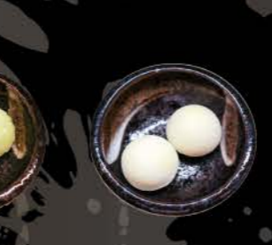
抹茶餅アイス Mochi matcha ice Grünteeeschnack gehüllt in japanischen Reiskuchen