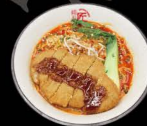
かき揚げベジ担々麺 Gemüse - Tempura Tan Tan Veggie Tan Tan mit Gemüse Tempura