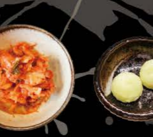
キムチ Kimuchi Fermentierter Kohlsalat mit Gewürzen.